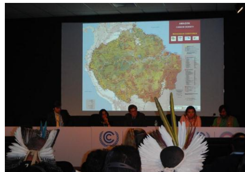
Conferencia de prensa y Side Event de lanzamiento del mapa.

Además, participaron como panelistas en varios Side Events (eventos paralelos) y en Eventos en el Pabellón Indígena.